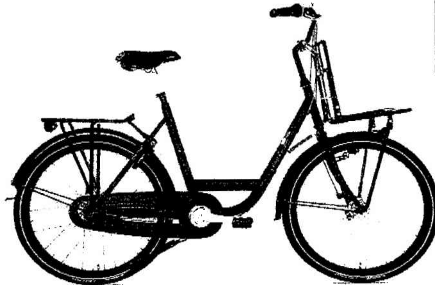
Mover 3 Mat Oranje

2.3. Batavus heeft Blomson (voor het eerst) op 18 juli 2007 gesommeerd om de productie en verhandeling van het model Montego Mover te staken. Blomson heeft geen gehoor gegeven aan deze sommatie.