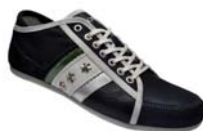
Rucanor – estrela

Ofschoon in dit model meer verschillen kunnen worden aangewezen, laat zulks onverlet dat de beschermde trekken ook hier grotendeels terugkeren. Het verbod zal naast het hiervoor afgebeelde type met artikelnummer 27768-04 ook gelden voor de varianten met de artikelnummers 27768-01, 27768-02 en 27768-03.