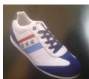
Rucanor – voice

geldt dat het naar voorlopig oordeel een zelfde totaalindruk maakt als de links afgebeelde Pantofola evenknie. Het verbod zal naast het hiervoor afgebeelde type met artikelnummer 27884-03 ook gelden voor de varianten met de artikelnummers 27884-01 en 27884-02.