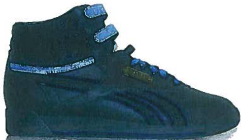
Freestyle type F/S Hi Int.