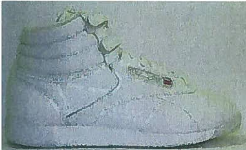
De Freestyle Classic