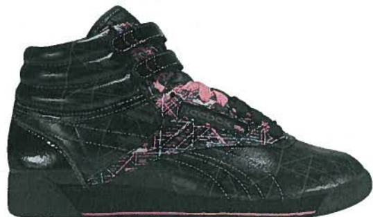
Freestyle type F/S Hi Tokyo