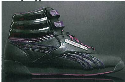
Freestyle type F/S Hi Birthstone