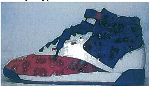
Freestyle type F/S Hi Int. Snowflake