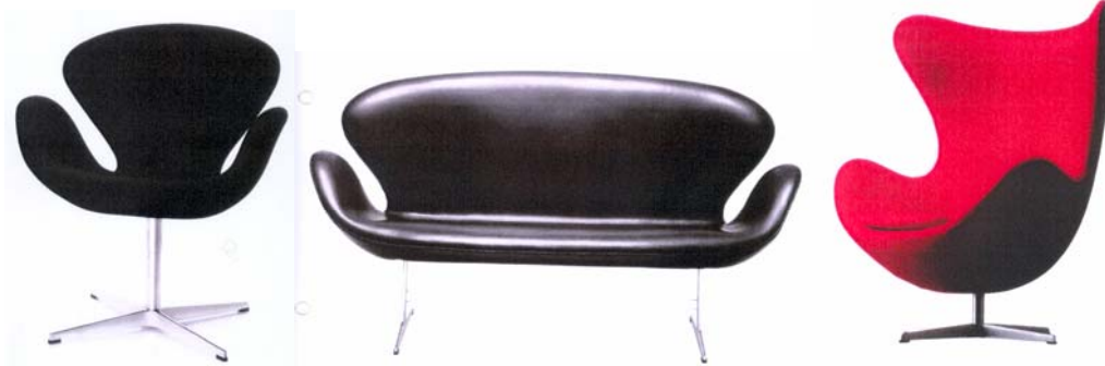
The Swan (stoel)

2.2. De collectie van Hansen omvat meubels van de Deense ontwerper Arne Jacobsen (hierna: Jacobsen), waaronder de hierna afgebeelde stoel en sofa genaamd The Swan en de stoel genaamd The Egg: