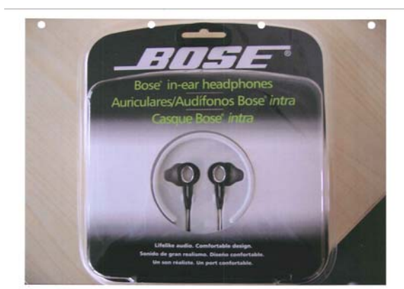
De door X aangeboden Y-Hoofdtelefoon