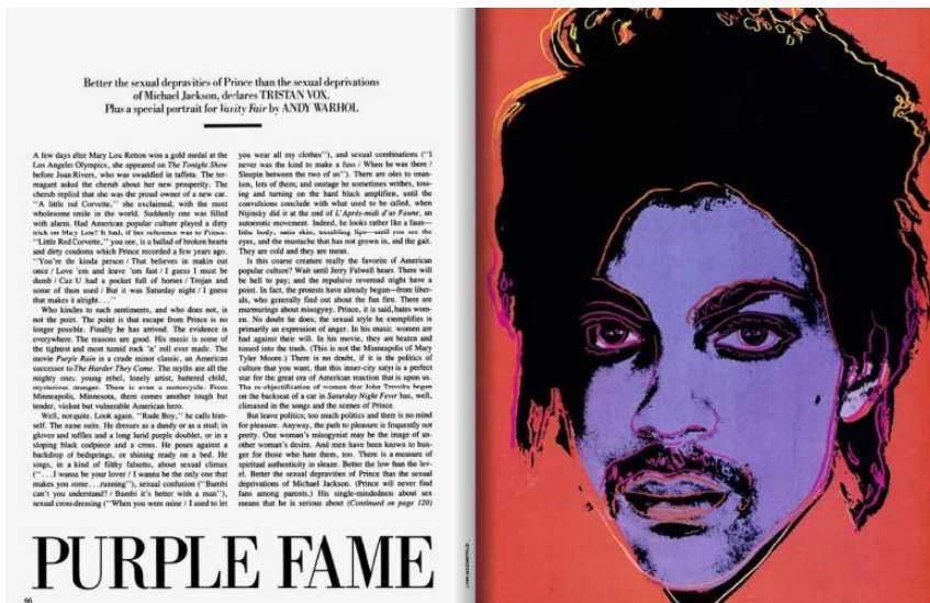
Publicatie 1984 Vanity Fair

De oorsprong van de zaak ligt in 1984, toen het tijdschrift Vanity Fair bij het verschijnen van het nummer Purple Rain een artikel wilde publiceren over Prince. Het tijdschrift kreeg toestemming van Lynn Goldsmith om voor de illustratie eenmalig een foto van Prince te gebruiken. Vanity Fair vroeg vervolgens aan Warhol om op basis van deze foto een portret te maken. En zo werd het artikel gepubliceerd, met een paarse prent van Prince. Goldsmith stond keurig vermeld als maker van de foto.