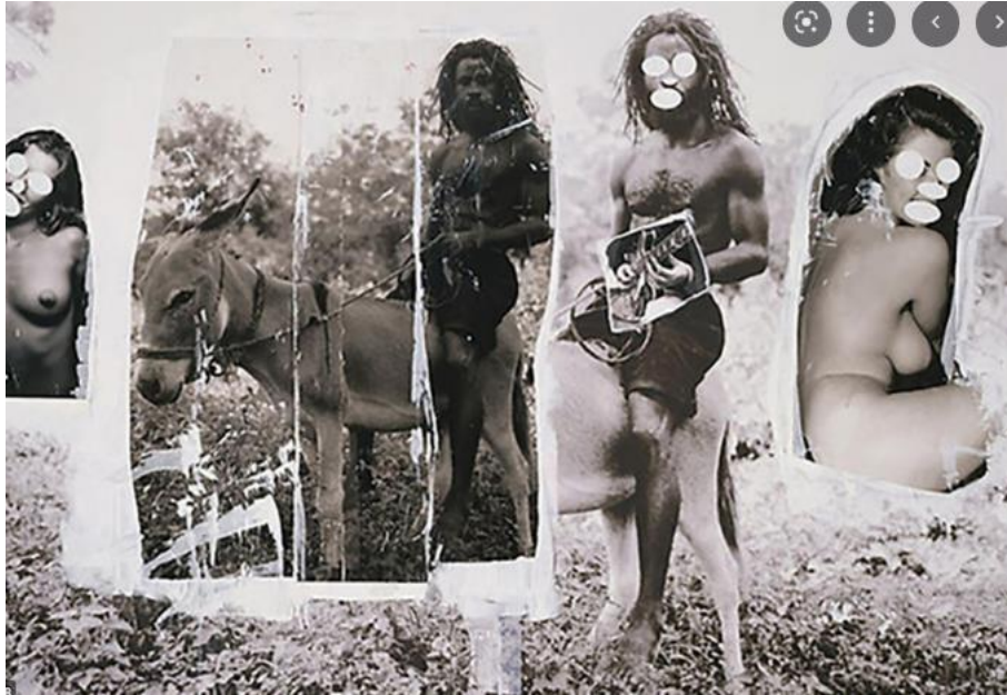
"Back to the Garden," van Richard Prince, voldoende 'transformatief', fair use