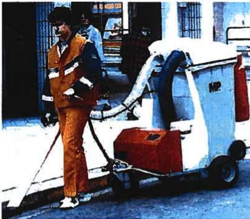
De Piktou-afvalzuiger van MP