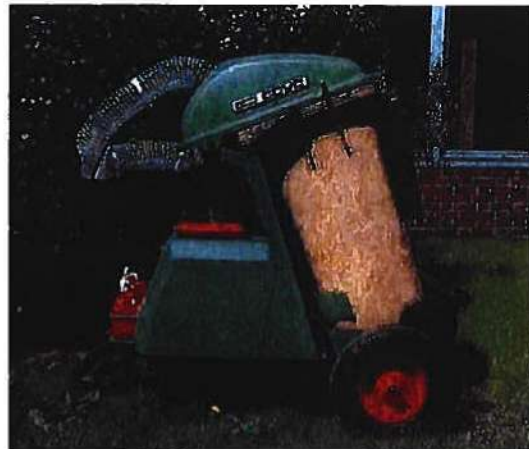
De CCVC-afvalzuiger van ECHO

2.4. importeerde eind jaren tachtig/begin jaren negentig van de vorige eeuw de Piktou-afvalzuiger. Hij besloot in 1994 een eigen afvalzuiger te ontwikkelen. Dit werd de Glutton waarvan hij eind maart 1995 op de milieubeurs "Best" in Namen, België, een prototype heeft gepresenteerd, zoals afgebeeld op onderstaande foto: